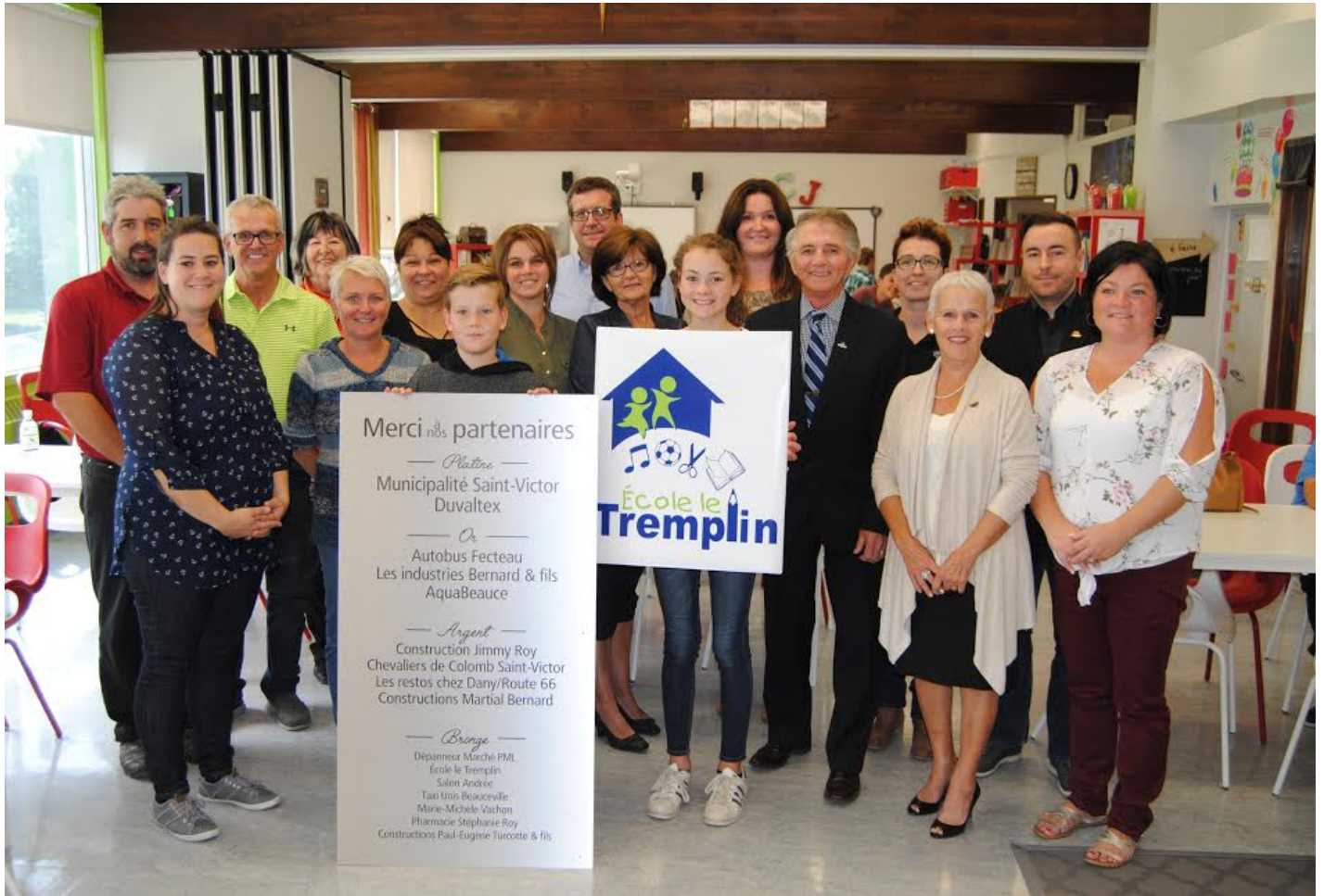
6 octobre : Conférence de presse sur le 50e anniversaire de l'école le Tremplin dont la présentation du nouveau logo de l'école. Sur la photo : Les enseignantes, la direction, les partenaires, le maire de Saint-Victor et les représentants de la CSBE lors de la présentation de la nouvelle grande classe.