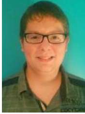
Par Sébastien Lapierre Administrateur à la CDI Saint-Victor