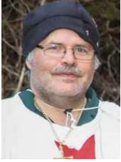
Par Mario Tardif Promoteur

Depuis une douzaine d'années, des personnes de 15 ans et plus participent à un jeu de rôle