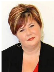
Par Caroline Pépin Coordinatrice d'événements

Au cours des derniers mois, la Municipalité de Saint-Victor demandait à la population de nommer des gens ou organismes