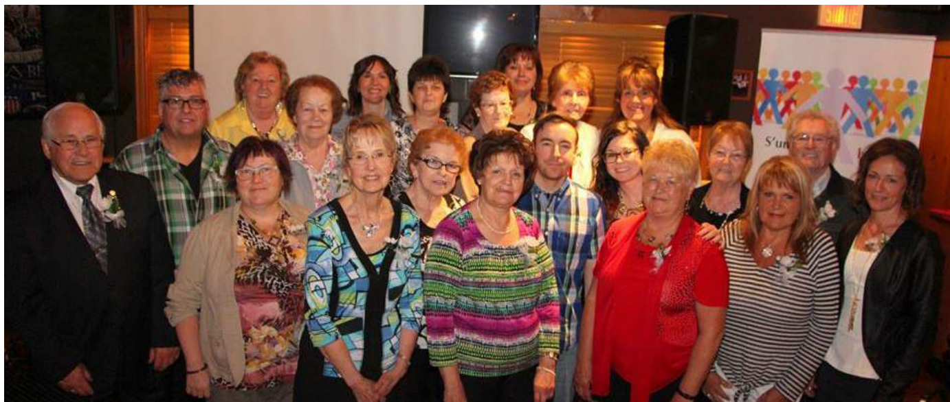
Photo prise à la soirée du 22 mai au Pub Davidson.

Bravos aux personnes qui ont été nominées et qui ont remporté un prix à la Soirée Reconnaissance!