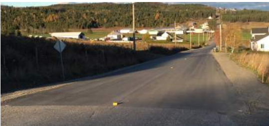
Rang Ste-Caroline réalisé l'an dernier