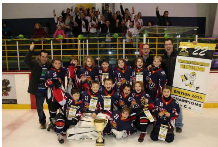
« Les Baroudeurs de Beauce Centre Atome C » qui ont remporté la finale au Tournoi Provincial Atome de Boisbriand.