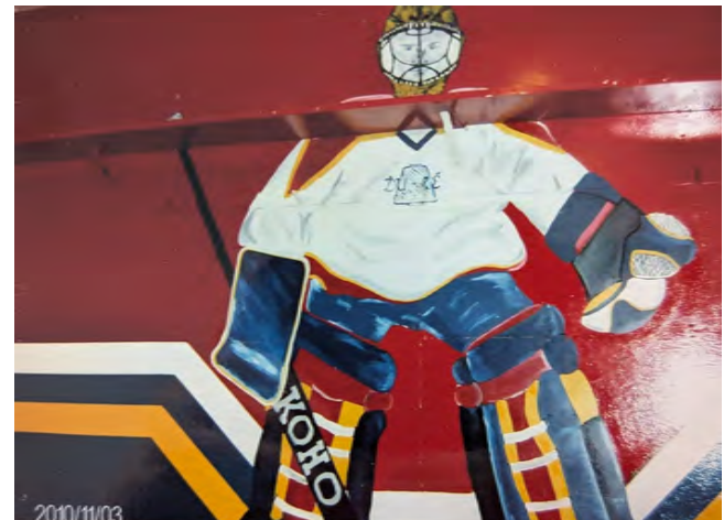
Peinture du 1 er vestiaire il y a 30 ans.