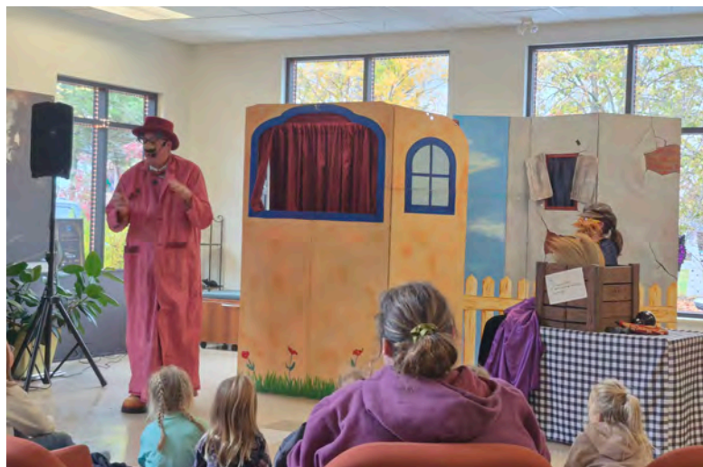
26 octobre : Spectacle d'Halloween à la Bibliothèque Luc-Lacourcière.