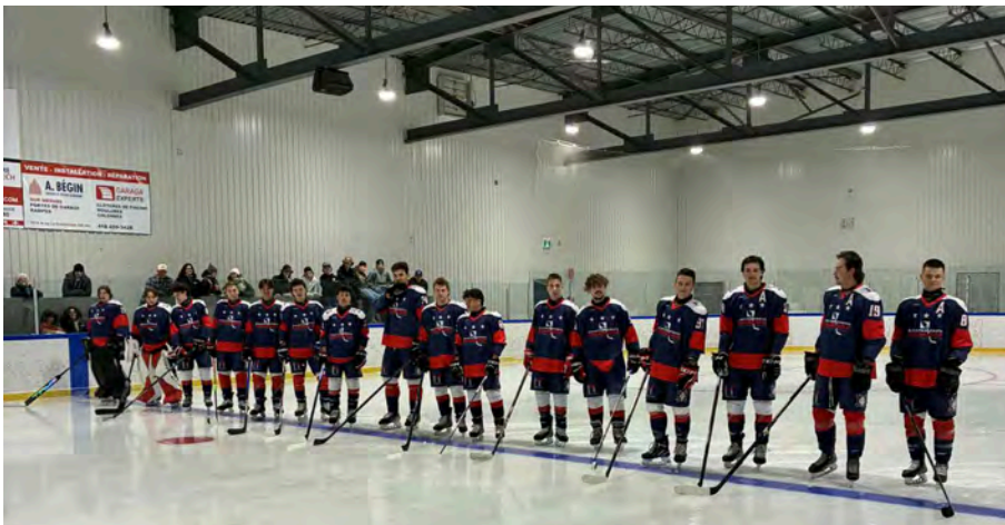
Solution Profil Financier Junior A De Saint-Victor saison 2025.