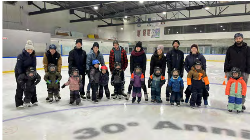
Cours de patin Initiation Rotary.