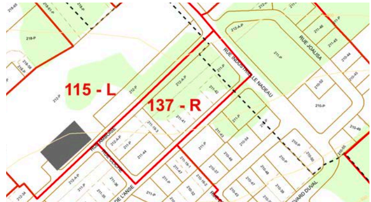
2006: Délimitations de la zone 137-R.