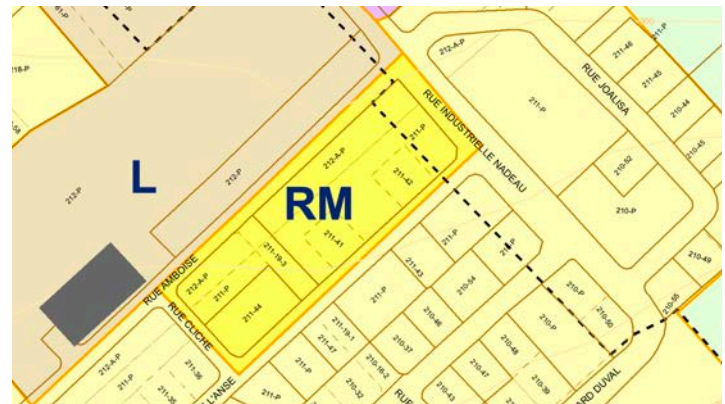
2006: Zone 137-R cote RM (Résidentielle moyenne/forte densité).