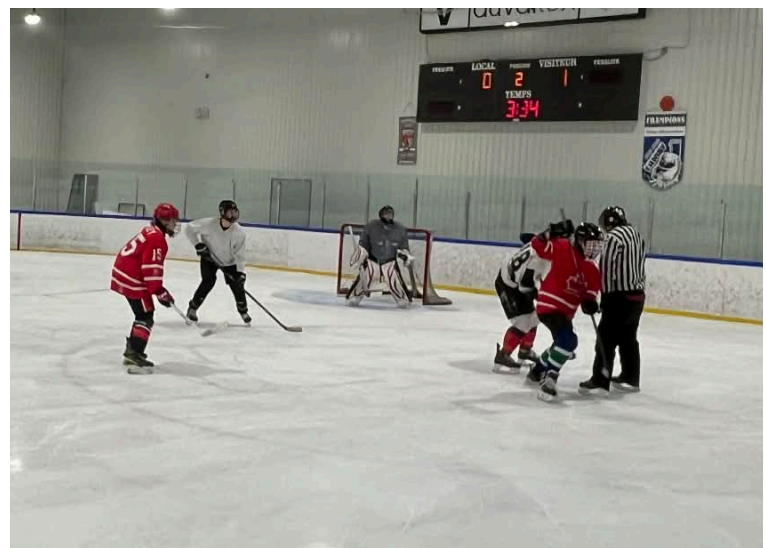
31 janvier: Tournoi 3 contre 3, match Les Rookies contre Les Bucks