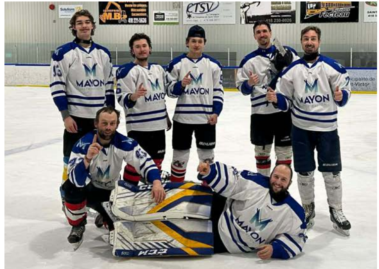
31 janvier: Tournoi 3 contre 3, vainqueur 2 e classe, Les Dépanneurs.