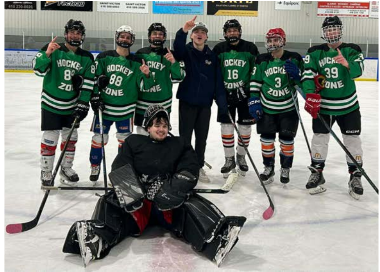
31 janvier: Tournoi 3 contre 3, vainqueur 1 ère classe, Bet 365.

Le mois de février est un bon temps pour avoir la communauté à cœur : venez découvrir toutes les ressources d'aide qui existent! (repas préparés, aide alimentaire, etc.)