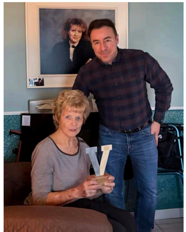
Novembre 2024: Remise du prix à leur résidence