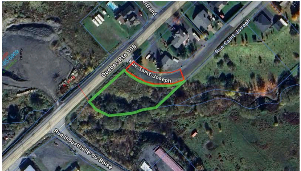
Rue St-Joseph: Portion de rue (approximative, en rouge) et terrain (en vert) ayant été vendus.

changeante que l'on connaît ces années-ci. En ce sens, des citoyens me demandaient dernièrement si l'on payait du temps supplémentaire pour ce faire - en fait, généralement non, car en hiver, la convention collective comporte une période spéciale du 1 er novembre au 31 mars, qui fait que par moments, il peut se faire beaucoup d'heures en peu de jours, selon la météo, et aucune heure d'autres jours. C'est gagnant-gagnant, les gars pouvant cumuler des heures pour récupérer en des jours ou périodes plus calmes, alors que du point de vue municipal, nos routes sont grattées sans payer d'extra. Un grand merci à David, Eric, Michaël, Robert et Simon, qui font de leur mieux pour assurer notre sécurité sur nos routes !