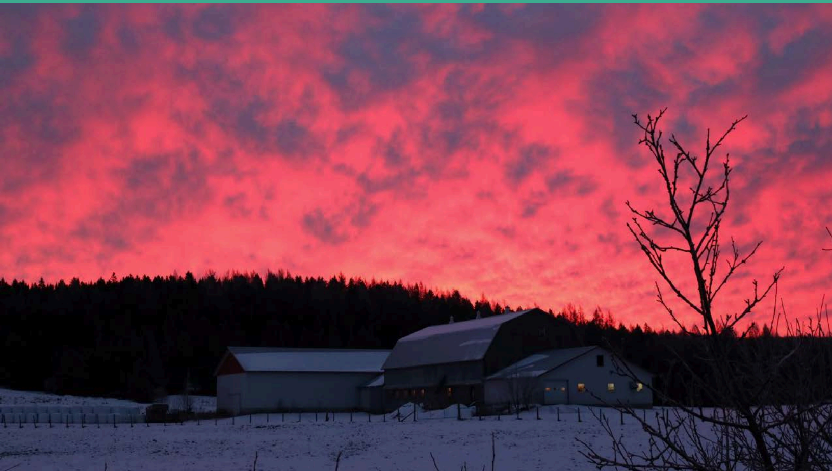
Lever de soleil dans le Chemin des Fonds | 2017 | Mélanie Bernard