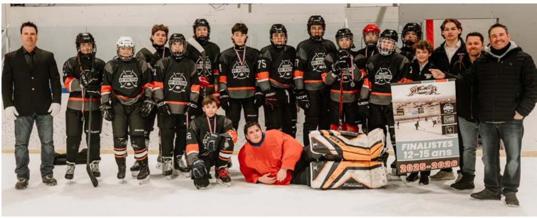
13 au 15 mars: Tournoi hockey sportif.