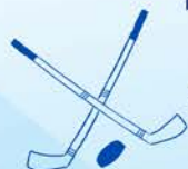
Table de hockey