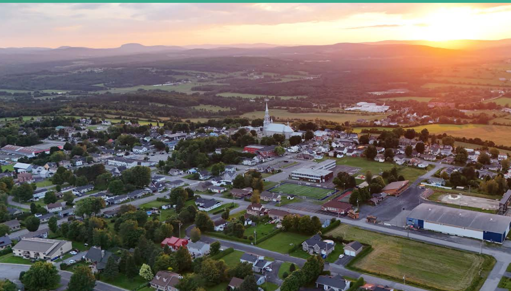
Coucher de soleil vu des airs | Juillet 2025 | Michel Mathieu