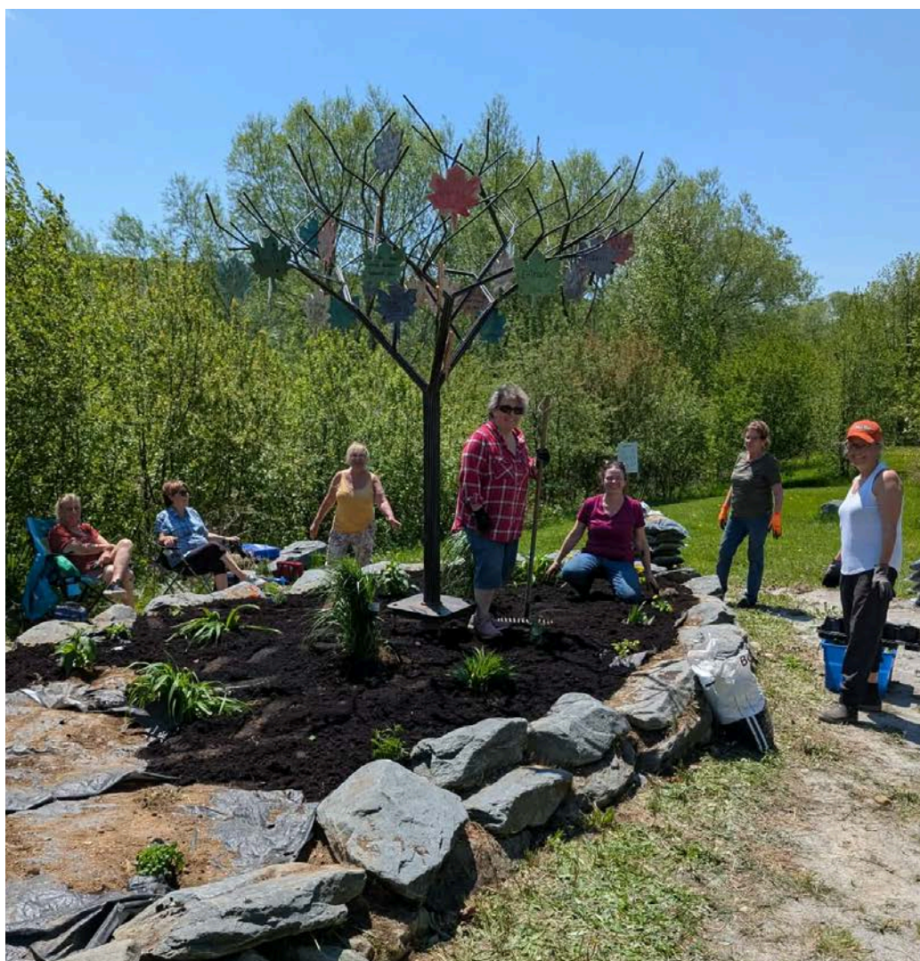
Merci à nos Fermières ! À l'oeuvre pour l'entretien de la section de l'arbre de fer.

INFO : www.st-victor.qc.ca/membership/cdi